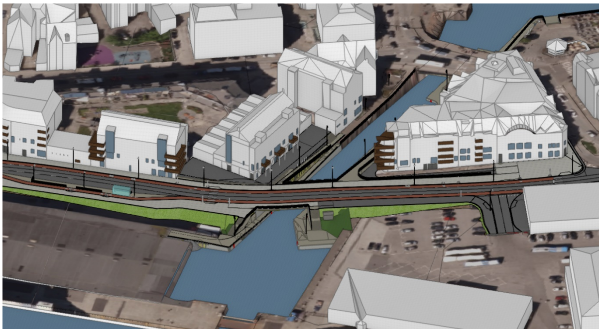
Figur 3 – Modell av ny bru over Brosundet

Dagens kryssing over Brosundet heter offisielt Helle brua , og det er det som står i kart. Men Ålesundere kaller den for Helle broa . Tradisjonelt har Ålesund vært en bokmålskommune, men etter kommunesammenslåingen 1. januar 2020 der bokmålskommunen Ålesund ble slått sammen med nynorskkommunene Skodje, Ørskog, Haram og Sandøy ble målformen i den nye storkommunen nynorsk. Vi har altså foreslått «Stornesbrua», men det bør kanskje vurderes om den skal skrives som «Stornesbroa» siden den ligger i bysentrum der de fleste vil kalle den for nettopp det.