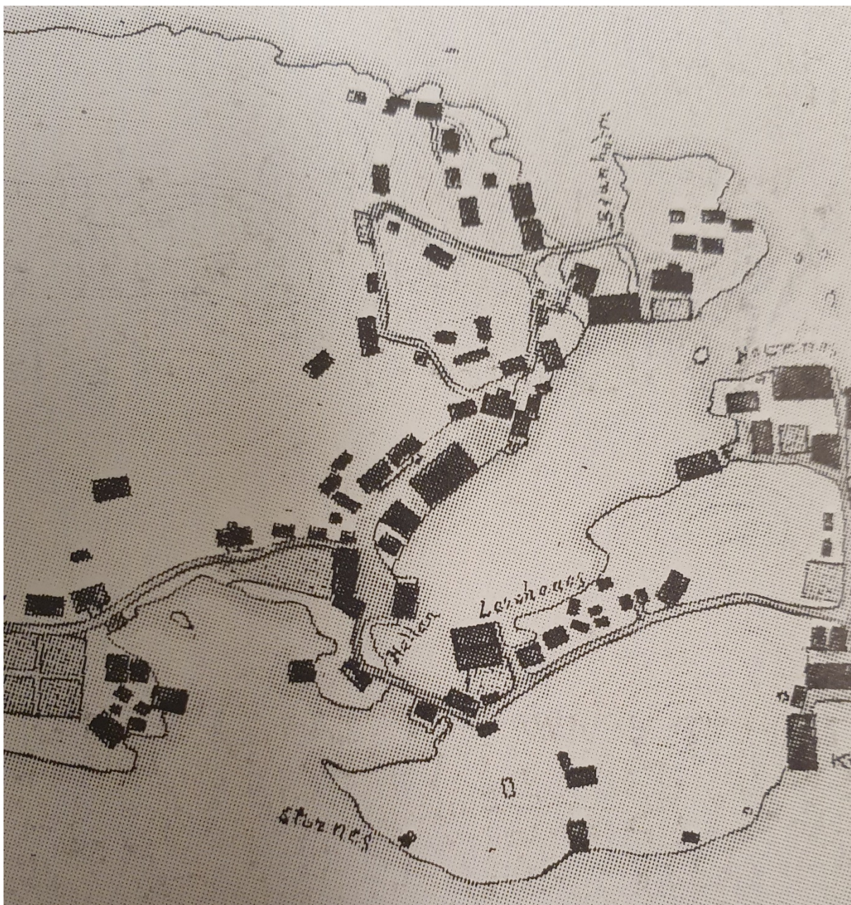
Figur 2 – Gammelt kart fra Ålesund sentrum som viser Storneset

På østsiden av Brosundet der brua skal bygges, lå der et nes. Dette neset fikk navnet Storneset. Siden har noe av neset blitt fjernet og området rundt fylt ut og det ble bygd ei kai, Storneskaia, som ligger like sør for den nye brua.