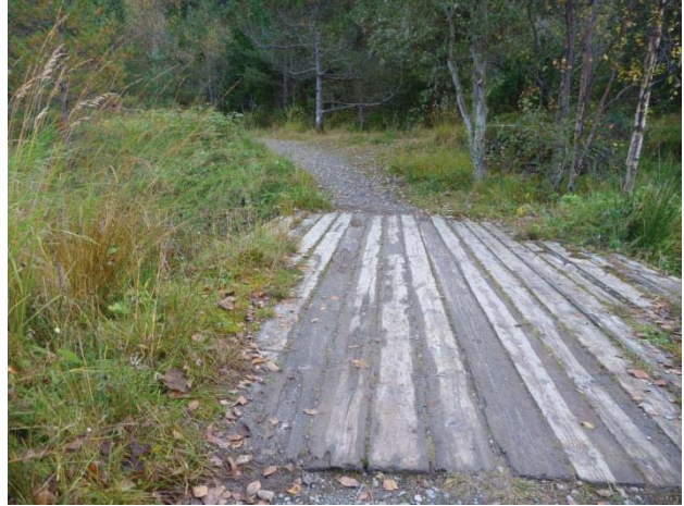
Turveg rundt Lerstadvatnet