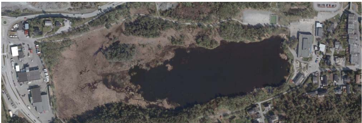
Lerstadvatnet med turvegen rundt. Lerstad skule i austkanten av vatnet.